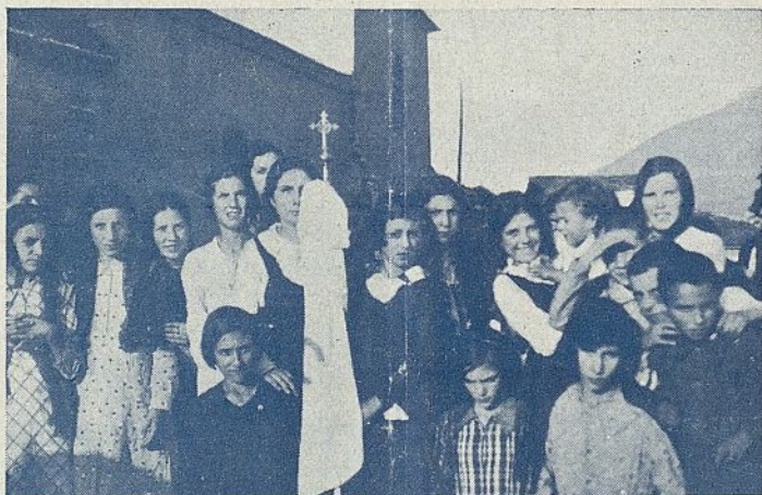
El 15 de agosto, fiesta de la Asunción de Nuestra Señora, se celebró en la Rúa de Valdeorras, diócesis de Astorga, el solemne acto de la bendición del banderín e imposición de insignias a las aspirantes de la J. F. de A. C.

Para sujetar el habero alrededor del cuello del niño ponerle una cinta colorada.