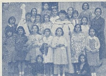
Toro.—Un grupo de aspirantes, con el consiliario y delegada, después de la bendición de la bandera

A las ocho y media de la mañana salíamos de esta población las aspirantes, acompañadas del señor consiliario y la delegada de esta Sección, en un lujoso autobús, en dirección a Santa Eulalia del Río.