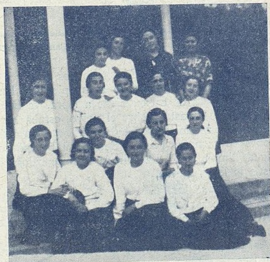
Grupo de Aspirantes del internado de Castillejos (Sevilla), después de la imposición de insignias

El Consejo Superior, de acuerdo con la Redacción de Prensa, está estudiando las mejoras que se pueden llevar a cabo en breve plazo en el órgano de la sección de Aspirantes, VOLAD. Por lo tanto, ruega a las Uniones Diocesanas y a sus delegadas que tengan un poco de paciencia y pongan el mejor cuidado en que no haya bajas en las suscripciones, antes fomenten entre las niñas el amor a su revista, que se propone ser para ellas uno de los mejores medios de formación y propaganda de su obra.