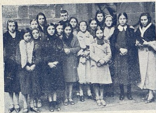
LOGROÑO.—Grupo de Aspirantes de J. F. de A. C.

Se vende en el Almacén Central de la J. F. de A. C., al precio de 2,50 pesetas encuadernado y 1,50 en rústica