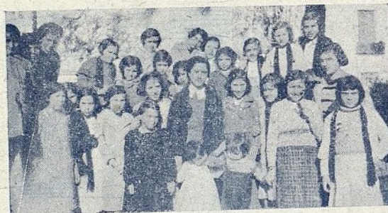
ARJONA.—Aspirantes que colaboran en el ropero infantil