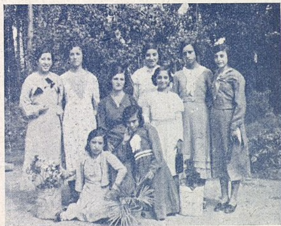
Aspirantes de Carabaña (Madrid) después de serlas impuesta su insignia