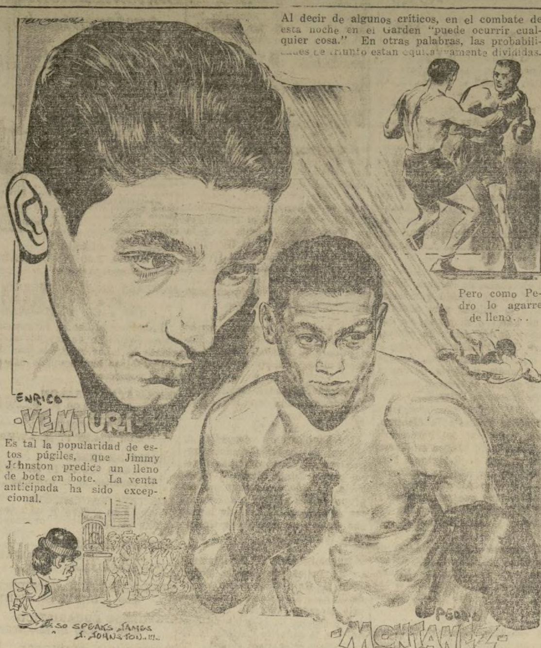
Es tal la popularidad de estos pugiles, que Jimmy Johnston predice un lleno de bote en bote. La venta anticipada ha sido excepcional.

Al decir de algunos críticos, en el combate de esta noche en el Garden "puede ocurrir cualquier cosa." En otras palabras, las probabilidades se están equilibrando.