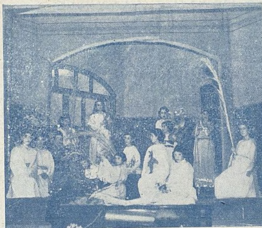
BURGOS.—Grupo de Aspirantes que representan la vida de su Patrona