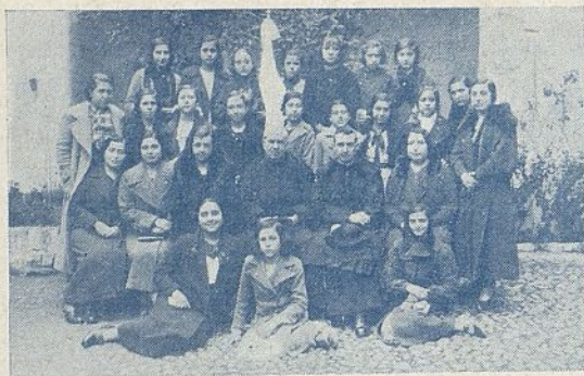
CORDOBA.—Grupo de Aspirantes de la J. F. de A. C. después de la bendición de su banderín