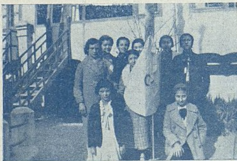
ZARAGOZA.—Aspirantes de la parroquia de Santa Engracia el día de la bendición de su bandera