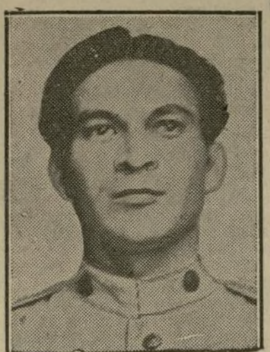
Coronel Fulgencio Batista

En una carta al senador Cañas Milanes, dice que su "mayor aspiración es asegurar la estabilidad de la nacionalidad cubana".—Cañas había dicho que el partido liberal postularía a Batista. —Mejora el conde de Covadonga.