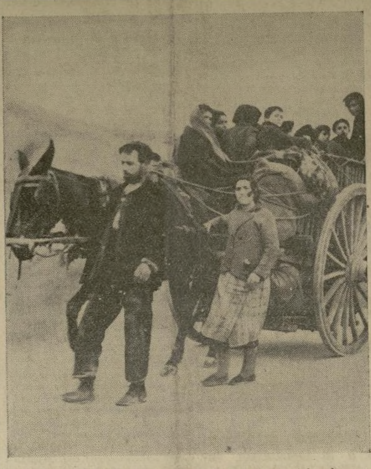
Refugiados de Madrid, cargando con lo más esencial, salen en dirección a Cuenca, huyendo de los horrores de los continuos bombardeos aéreos y de artillería a la capital de España.