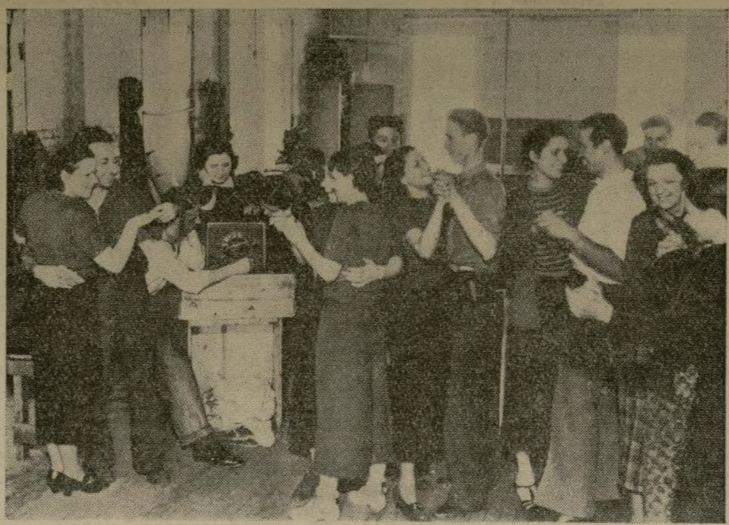
Los empleados de la Brook Manufacturing Company, Scranton, Pennsylvania, después de un encuentro entre huelguistas y no-huelguistas en las afueras de la fábrica, bailan después de las horas de trabajo, decidiendo permanecer dentro en vez de ir a sus casas y arriesgarse a que los molesten los huelguistas que hacen servicio de "piquete" en la fábrica.