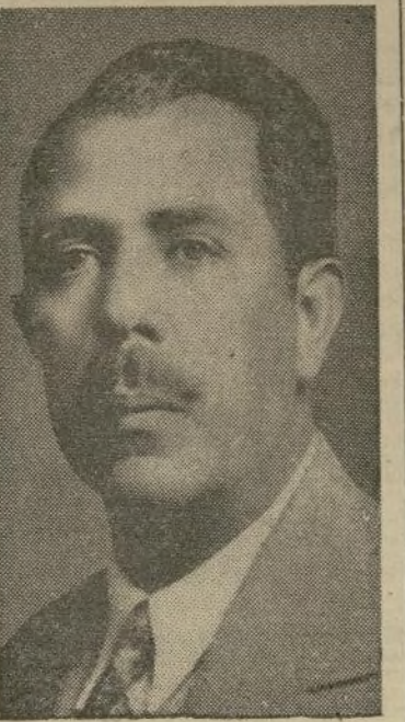
Pdnte. Lázaro Cárdenas