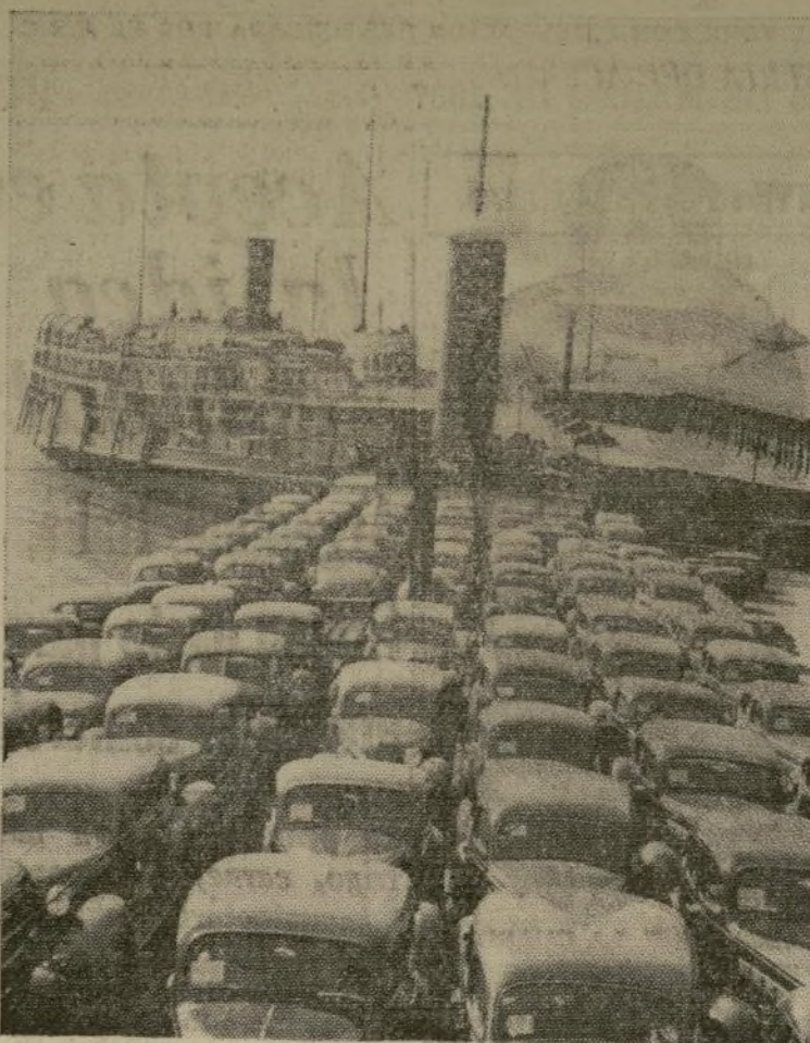
El barco de carga "William S. Fitch," cargado con 300 automóviles nuevos, saliendo de su muelle para hacer el primer viaje de la primavera a Cleveland, al reanudarse el tráfico de vapores en los lagos.

Embarcación con autos nuevos sale de Detroit