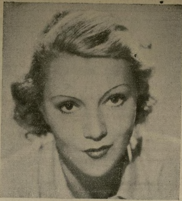
Annabella, nuevo astro del cinematógrafo que aparece con Henry Fonda y Leslie Banks en la película "Wings of the Morning" que presenta el Music Hall desde hoy jueves.