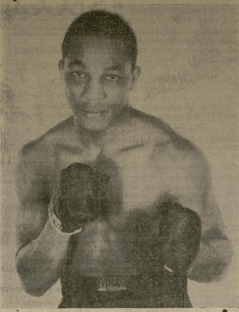
Atilio Sabatino, el campeón boricua del peso medio.