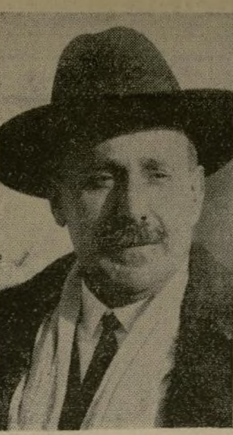
El célebre pintor Ignacio Zuloaga, quien, de acuerdo con una de las noticias del general Quipio de Llano desde la radio-emisora de Sevilla, ha sido condenado a muerte en Bilbao.