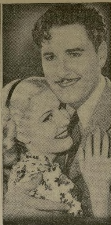
Anita Louise, bella actriz rubia de la pantalla sonora la cual aparece con Errol Flynn en la película "Green Light" que presenta desde hoy el Teatro Regent de la RKO.