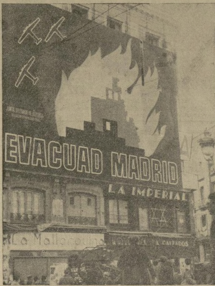
Consejo, pintado en letras de seis pies de alto en una casa de la Puerta del Sol, que forma parte de la campaña para influenciar a los no-combatientes de Madrid para que la abandonen.