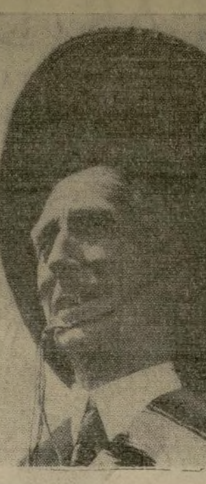
Connie Mack, quien se ha transformado en un "gay" caballero desde que llegó a Méjico con los Atléticos de Filadelfia. Este equipo está celebrando su temporada de entrenamiento en Ciudad de Méjico.