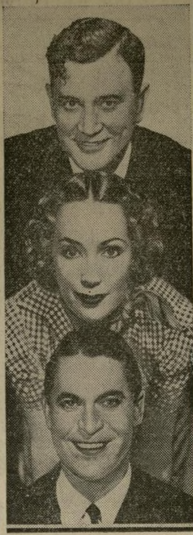
Richard Dix, Dolores del Río y Chester Morris, protagonistas de la película "The Devil's Playground" que exhibe el Teatro Loew's de la Calle 116.