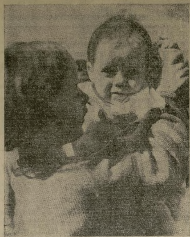
Una niña de Madrid enseña a su hermanito el saludo del puño cerrado de la España leal.