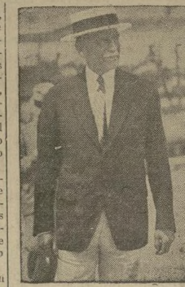
Gobernador Blanton Winship

Campaña terrorista Los licenciados Vito Marcantonio y Gilberto Concepción de Gracia, miembros del cuerpo de defensa de Pedro Albizu Campos y otros jefes nacionalistas encarcelados en Puerto Rico después de haber sido declarados culpables de conspirar para derrocar el gobierno de los Estados Unidos en la isla, hicieron públicas ayer declaraciones en las cuales sostienen que lo ocurrido en Ponce es parte de "la campaña de terrorismo llevada a