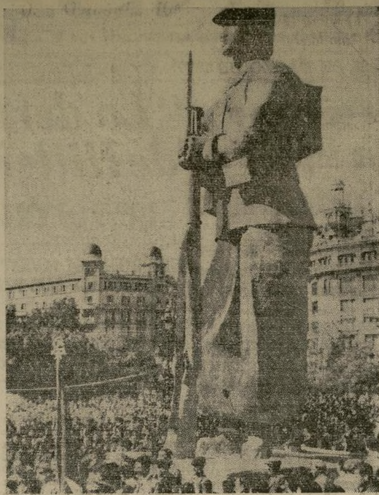
Enorme estatua de yeso representando un soldado leal, erigida en una plaza de Barcelona, en memoria de los que han muerto en la guerra civil.