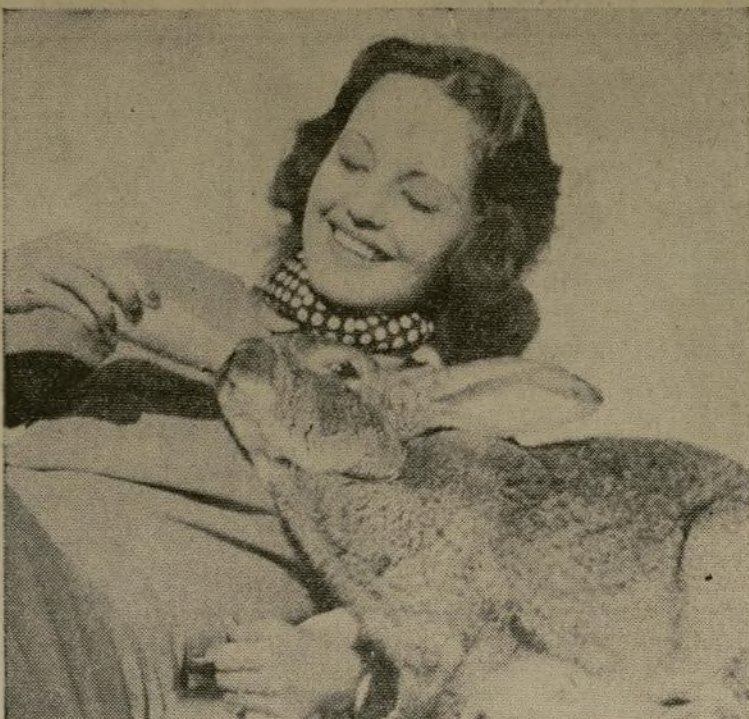
Un conejo que puede calificarse en la categoría de los "pesos completos" y cuyo nombre es "Cactus", se come una zanahoria que le ofrece Rochelle Hudson, estrella de una película en la cual participara "Cactus". El conejo, por naturaleza, gusta de las zanahorias, y cuando éstas son obsequio de Miss Hudson... entonces les gustan más.