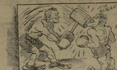
A Lou le han pegado en la barbilla expertos como McLarnin y Canzoneri, sin éxito. Pero Pedro es más joven y fuerte que ellos.