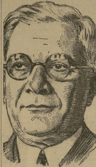
General Gerardo Machado

La tercera condición se refiere a los países exportadores que no se hallan dentro del plan Chadbourne que habrían de subscribir compromiso de no aumentar el volumen de sus exportaciones actuales. En cuanto a los países afiliados al plan Chadbourne, sólo quedarán obligados a seguir dentro de (Signe en la cuarta página)