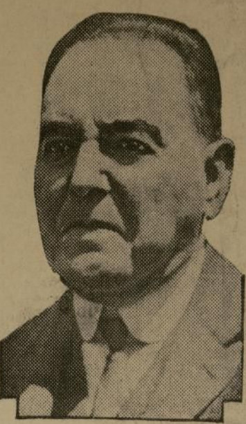
Doctor Hipólito Irigoyen

Los secretarios de Guerra, Mr. Dern, del Interior, Ickes, y de Agricultura, Wallace, llegaron en automóvil desde Washington y al descender de sus respectivos co-