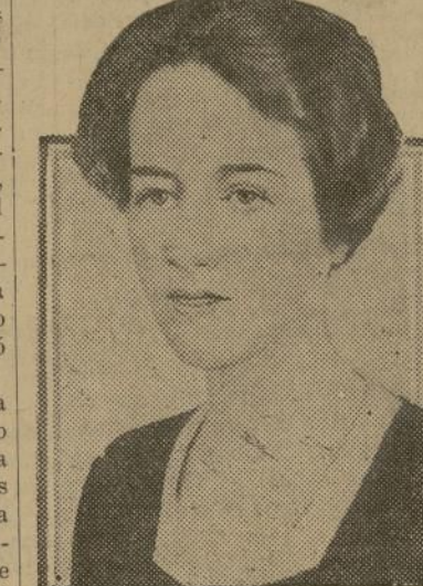
Mrs. Charles A. Lindbergh