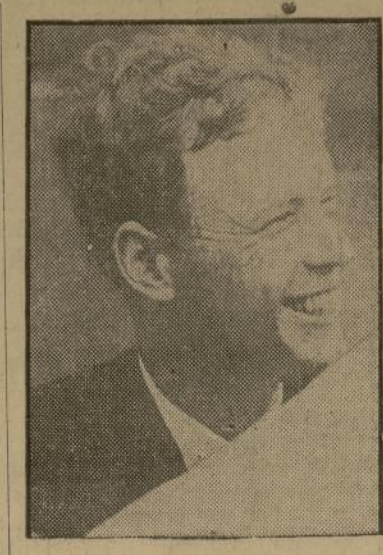
Cor. Charles A. Lindbergh