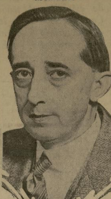
Mr. Claude G. Bowers