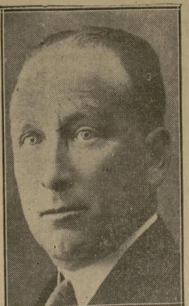
Sr. Largo Caballero