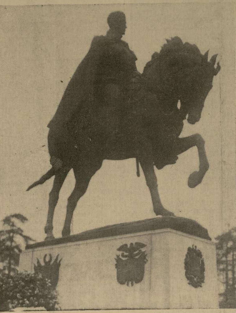
Estatu ecuestre del Libertador Simón Bolívar, ante la cual se celebrará hoy el homenaje de las naciones bolivarianas.

del Libertador. Figura fué la su- ya que trasciende en grandeza a todas las demás que ha producido la historia americana y, desde lue- go, se paragona por su magnitud real y la proyección de su obra grandiosa en el porvenir del mun- do, con las más excelsas de la ga- lería universal de la fama.