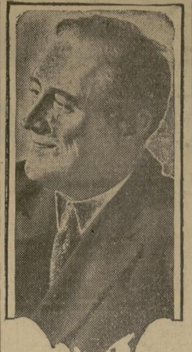
FRANKLIN D. ROOSEVELT