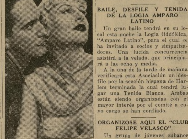
Fredric March y Carole Lombard en "The Eagle and the Hawk" que corre en el Jewel desde hoy hasta el lunes. Cansada de hacerse adorar... Ella era la única mujer para quien él no era un héroe.

La película que encabeza el programa cinematográfico se titula "Phantom Broadcast" y tiene como protagonista a Ralph Forbes, Vivienne Osborne y otros conocidos artistas de la pantalla.