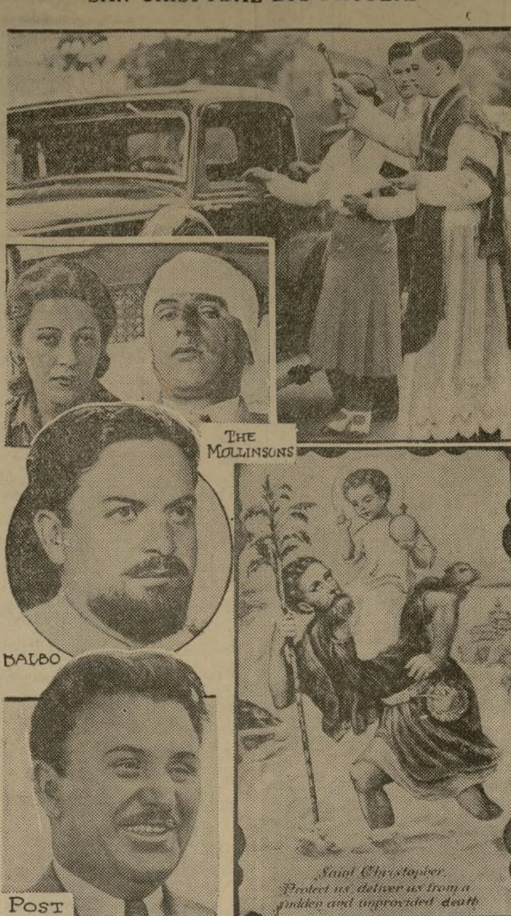
Post. Sabida es la fe que los aviadores y los automovilistas ponen en la protección que les concede San Cristóbal; que es el santo patrono de los viajeros. Es interesante saber que el general Balbo, los Mollinsons y Post, llevaban colgados al cuello o en los bolsillos, medallas del Santo, a pesar de que no todos pertenecen a la religión católica. En la iglesia de San Cristóbal, en Baldwin, N. Y., se bendicen los autos de los automovilistas que lo solicitan, como puede verse en la parte superior. Abajo una de las más populares estampas del Santo.

Sabida es la fe que los aviadores y los automovilistas ponen en la protección que les concede San Cristóbal; que es el santo patrono de los viajeros. Es interesante saber que el general Balbo, los Mollinsons y Post, llevaban colgados al cuello o en los bolsillos, medallas del Santo, a pesar de que no todos pertenecen a la religión católica. En la iglesia de San Cristóbal, en Baldwin, N. Y., se bendicen los autos de los automovilistas que lo solicitan, como puede verse en la parte superior. Abajo una de las más populares estampas del Santo.