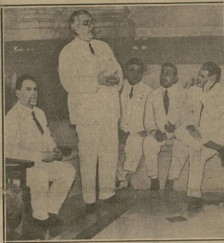
El general Machado, pronunciando ante el Senado de la Habana, su último discurso, desautorizando la "mediación" y anunciando que seguiría en el poder hasta 1935. A su izquierda, el comandante Barreras, presidente de la Alta Cámara.