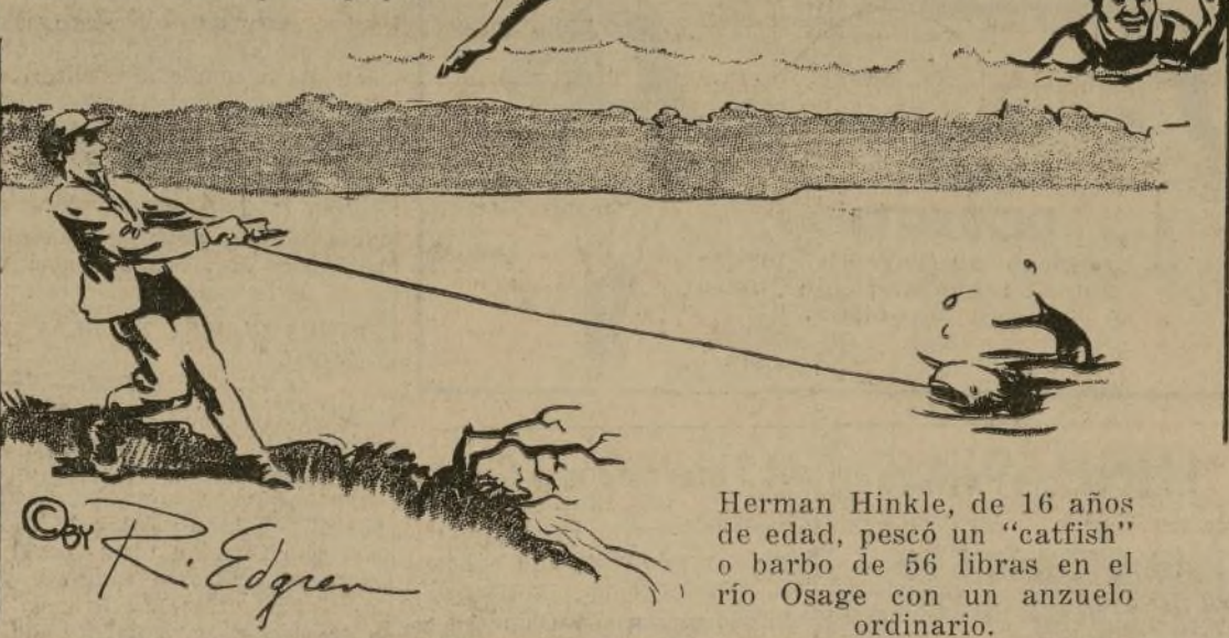
Herman Hinkle, de 16 años de edad, pescó un "catfish" o barbo de 56 libras en el río Osage con un anzuelo ordinario.

Y los 3 ganaron el campeonato de relevo por equipos!