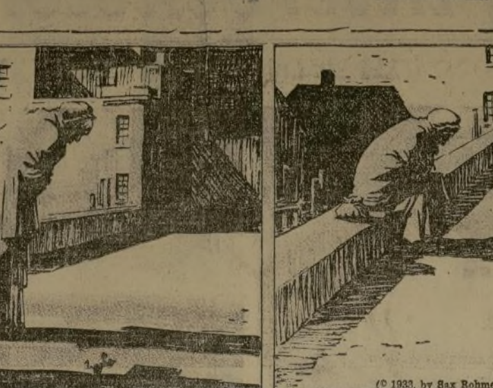
(C. 1933, by Sax Rohmer and The Bell Syndicate, Inc.)

Su cara apenas podía distinguirse, ya que estaba me- diamente oculta por su gorro negro, pero descansa el bulto sobre el lago negro del puente, y ante mí mayor sor- presa, sentada a su lado, ¡Evidentemente, la anciana pensaba quedarse allí por un rato!