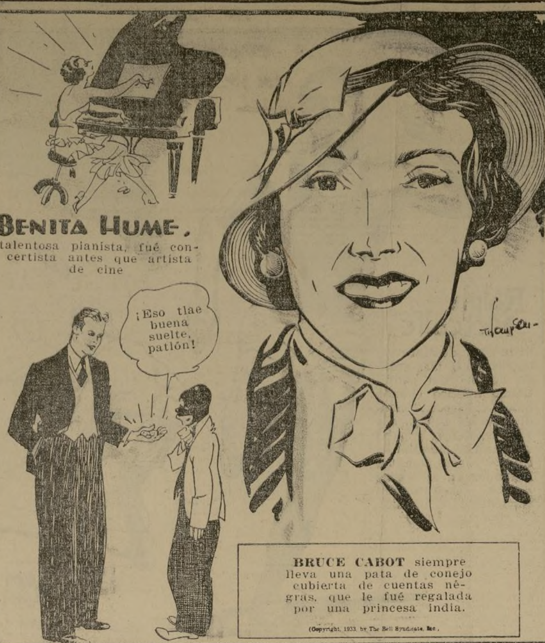
BENITA HUME , talentosa pianista, fue concertista antes que artista de cine