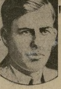
Mr. Henry A. Wallace

STONEVILLE, Miss., agosto 8 (P).—Hablando aquí ante una magna reunión de granjeros que se dedican al cultivo del algodón, el secretario de Agricultura, Mr. Henry A. Wallace, dijo que la tarea principal de la nación ahora consistía en transformar tan rápidamente como pueda su política nacional, de la de un país deudor a la de un país acreedor, que es lo que los Estados Unidos son actualmente. Relatando la cuestión de las deudas de guerra con las de las tarifas y analizando el efecto de ambas cosas sobre los agricultores, dijo que el exceso de producción agrícola del país, que no podía venderse, se deriva de la extraordinaria demanda que los productos americanos de agricultura tuvieron durante los días de la guerra.