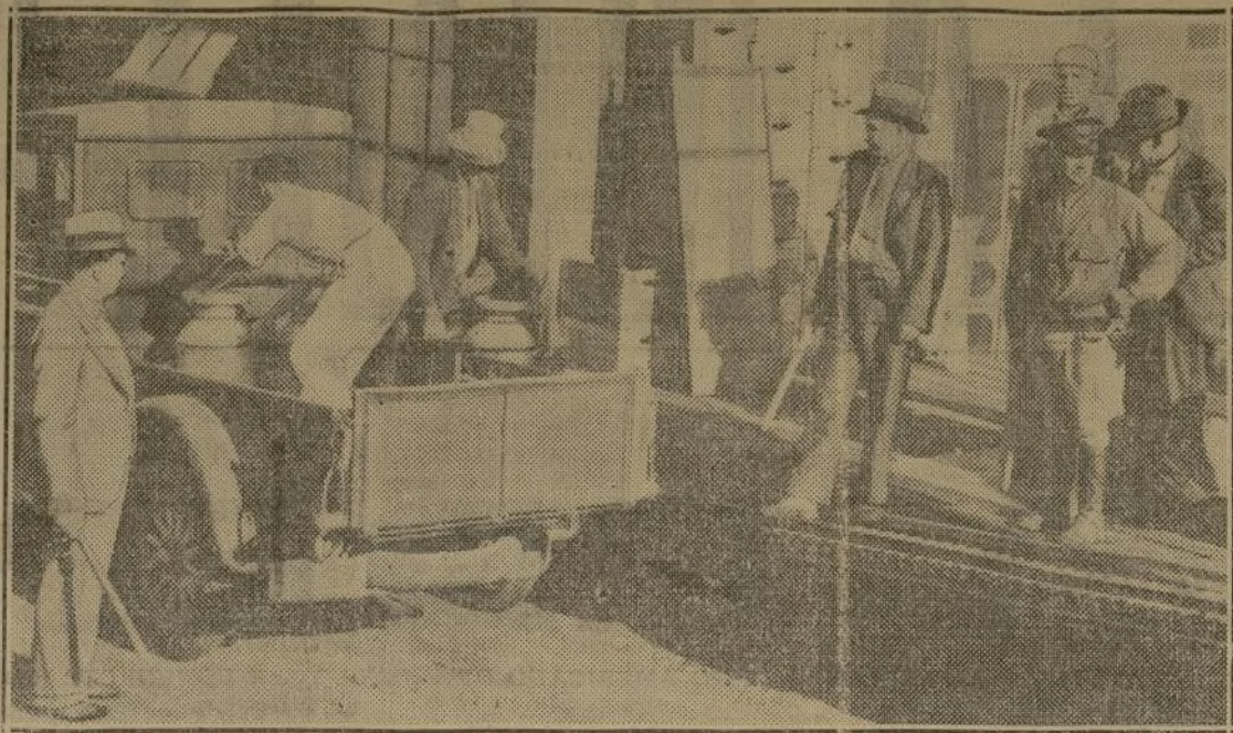
La policía rural y los detectives se tienen que encargar de la vigilancia de las plantas lecheras y cremerías del estado de Nueva York en vista de que los huelguistas han intentado asaltarlas en más de una ocasión. He aquí a las fuerzas protegiendo a uno de esos establecimientos en Liberty, N. Y., mientras los granjeros desargan la leche.