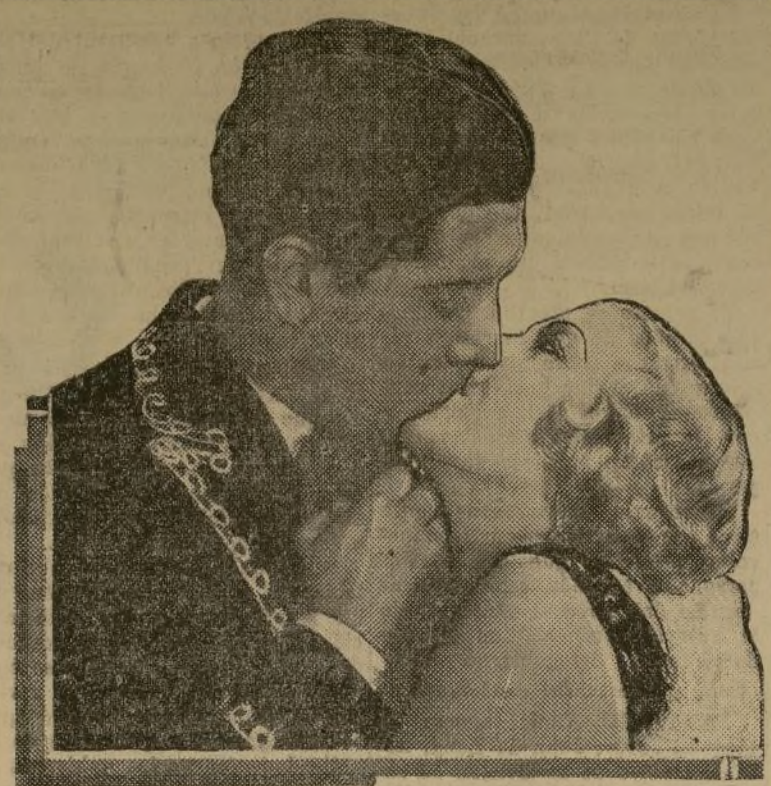
Torrida escena en la película que ahora se ofrece en el Teatro Variedades y que aparece el tenor mejicano José Mujica.