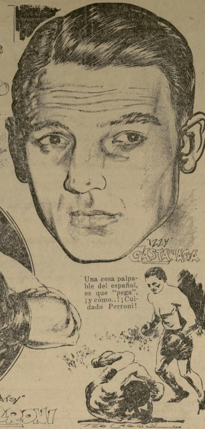
Una cosa palpable del español, es que "pega", y como... ¡Cuidado Perroni!