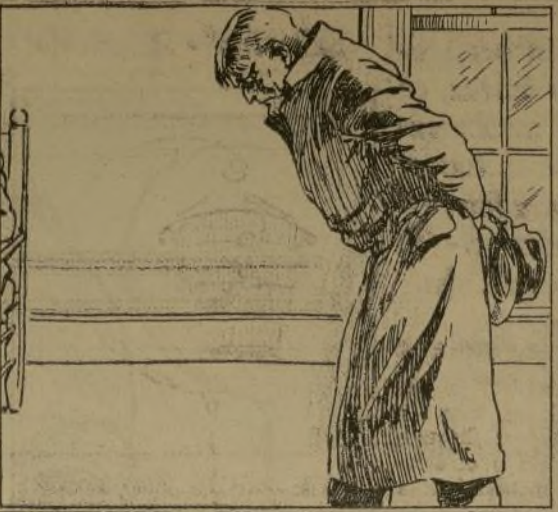
Nayland Smith se levantó abruptamente, comenzó a pisar por la alfombra...