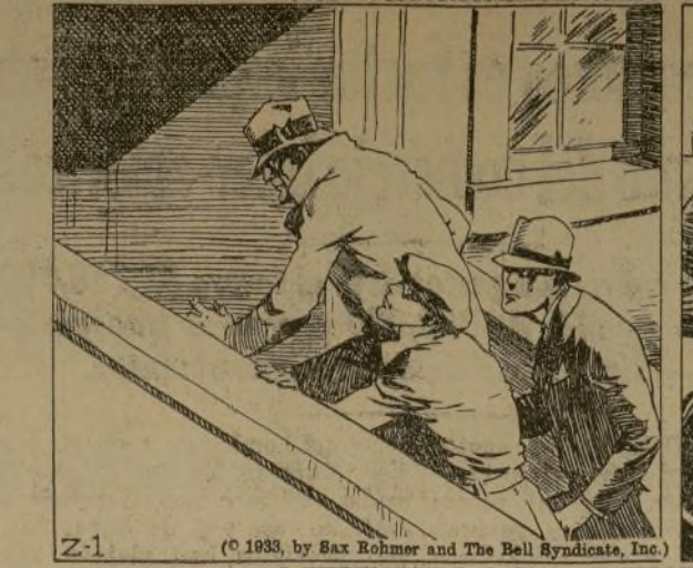
La llamada que nos había interrumpido en el momento del asalto del estragador chino...