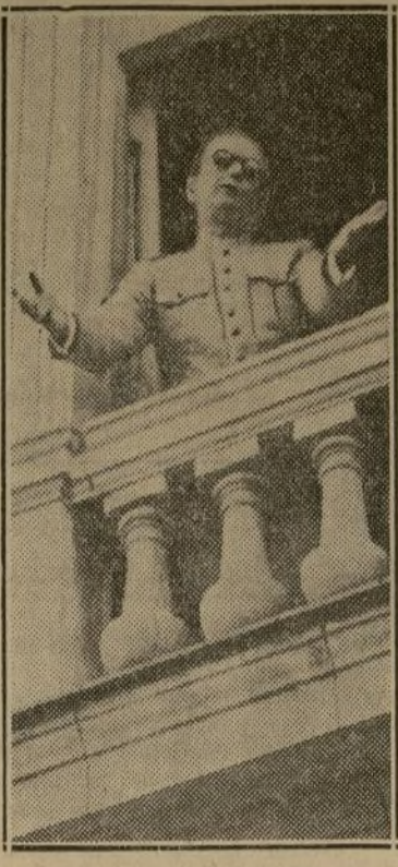
El nuevo Jefe de Estado del ejército cubano, desde un balcón de la embajada americana, ruega a los ciudadanos que depongan las armas y retornen a la tranquilidad de la paz.