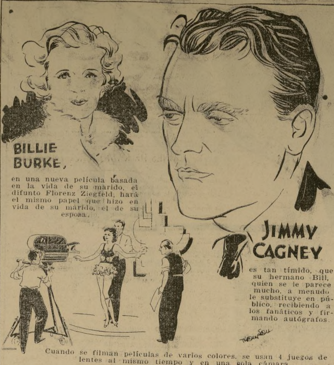
Cuando se filman películas de varios colores, se usan 4 juegos de lentes al mismo tiempo y en una sola cámara.