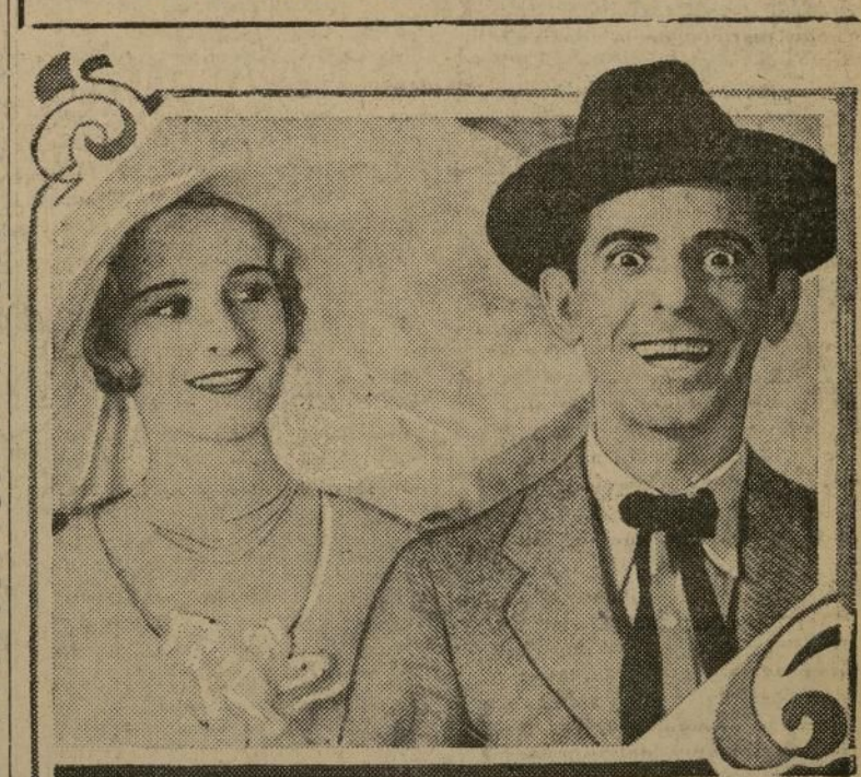
Aquí está Eddie Cantor, toda ojos, en su película "Whoopie".