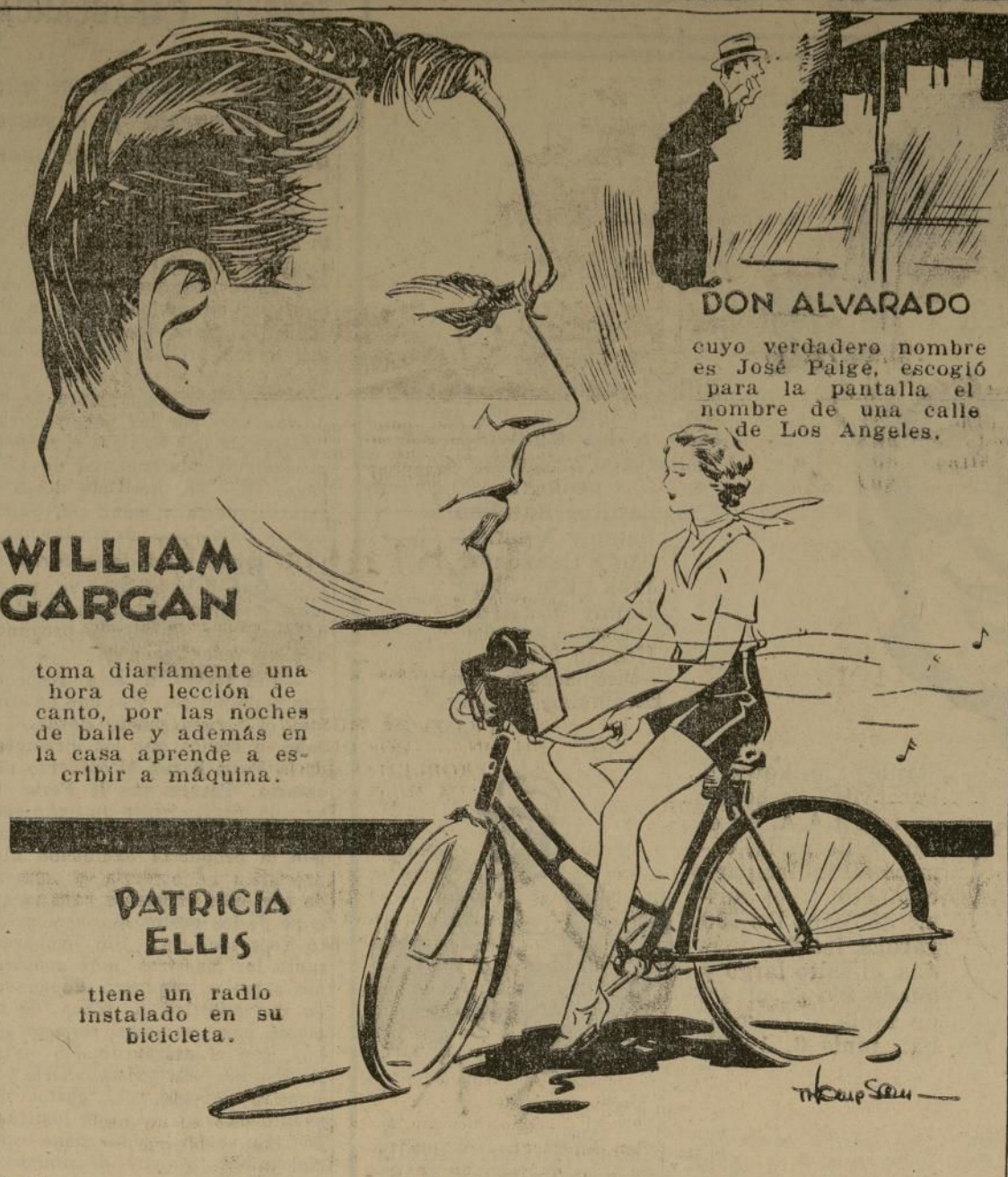
8-24 (Copyright, 1933, by The Bell Syndicate, Inc.)

Por ROBERT EDGREN (Copyright by Robert Edgren)