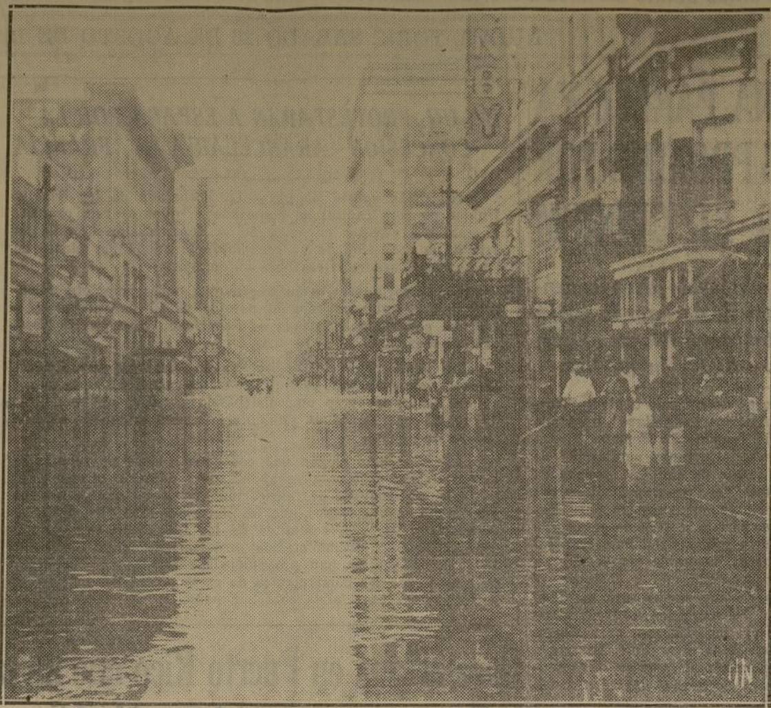
Norfolk, Virginia, soportó casi todo el peso del terrible ciclón que acaba de azotar la costa del Atlántico. Arriba, Main St., en aquella ciudad, inundada por dos pies de agua. Cálculase que los daños ocasionados por la inundación ascienden a $4,000,000.