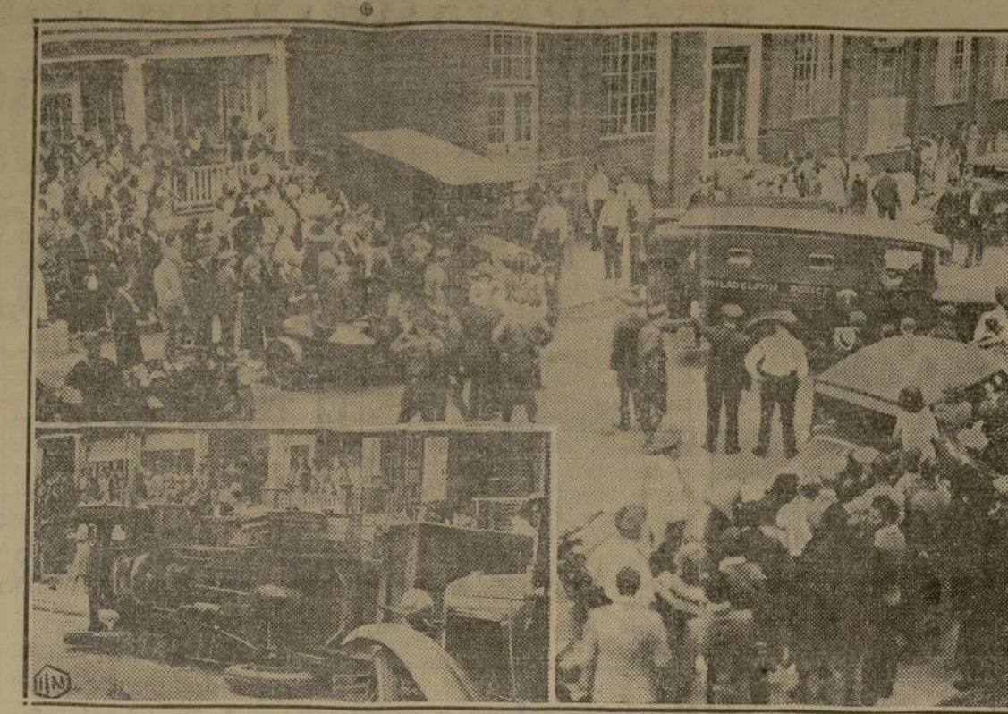
La policía de Filadelfia con sus autos restableciendo el orden delante del edificio de la Cambria Silk Hosiery Mills, en donde recientemente hubo una lucha entre la policía y huelguistas, que costó dos muertos y 18 heridos. Los sucesos se iniciaron porque los obreros parados vocearon el cántico que aparece en el ángulo del grabado, cuando éste se acercaba a la fábrica llevando trabajadores rompedores de gas.