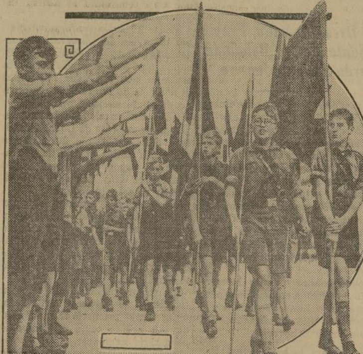
Los nazis siguiendo los procedimientos fascistas, instruyen a los muchachos de la generación que crece para que cuando sean hombres puedan defender a la patria (o ir a atacar al vecino). Arriba, parte de los cien mil muchachos que fueron recientemente revistados en Berlín en un imponente desfile. Abajo un grupo de jóvenes nazis durante un acto similar en Roma.