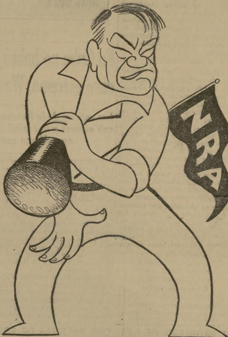
Massaguer, el celebrado caricaturista cubano, ve al General Johnson, Administrador de la NRA, no sólo como el piloto de la Rehabilitación económica, sino como el "cheer-leader" cuyo entusiasmo y dinamismo guía los destinos del Aguila Azul.