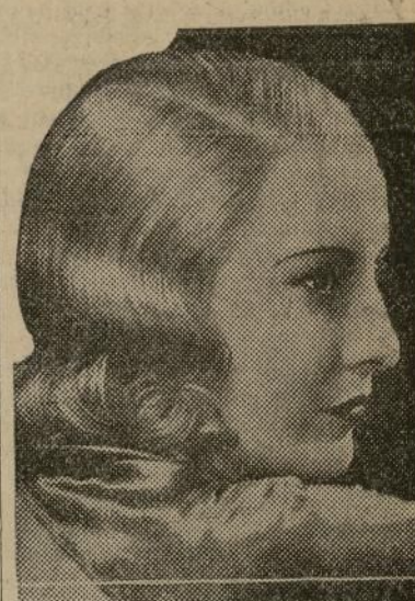
Barbara Stanwyck en "Baby Face", con George Brent y Donald Cook en el Loews Calls 116 hoy y mañana.