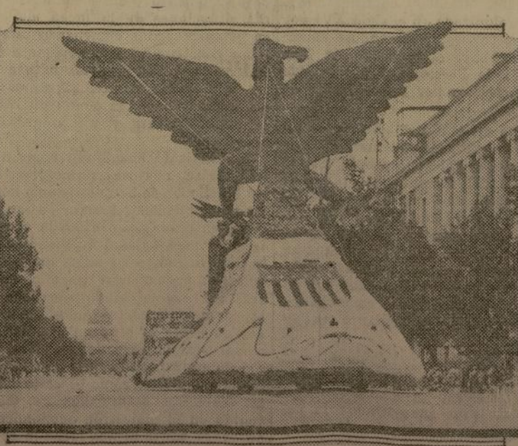
En el imponente desfile obrero en Washington el lunes pasado, con motivo de la celebración de "Día del Trabajo", esta contribución del Departamento de Bomberos representando el espíritu de la campaña de la NRA, fué la nota sobresaliente y más oportuna.