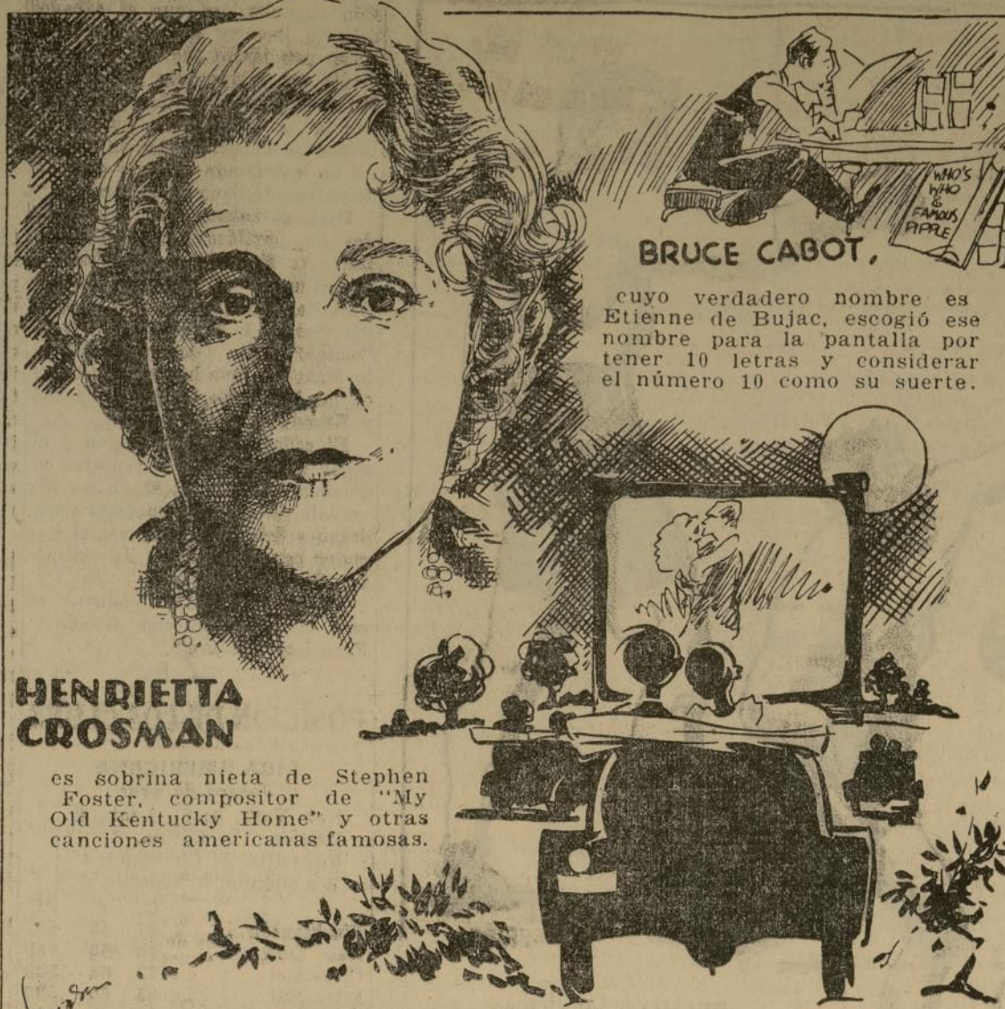
BRUCE CABOT, cuyo verdadero nombre es Etienne de Bujac, escogió ese nombre para la pantalla por tener 10 letras y considerar el número 10 como su suerte.