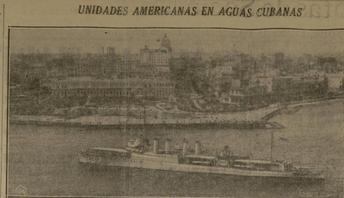
El "destroyer" de los Estados Unidos "McFarland" fondeado en plena bahía de la Habana, donde, junto con otros buques de la misma bandera ofrecen "apoyo moral" a la seguridad de la vida y propiedad americanas

La comunicación fue escrita por el Canciller Mello Franco después de las conferencias con los ministros Carcano Martínez y García Calderón. Aunque no se ha divulgado el tema tratado, todos los círculos que han tomado participación en las negociaciones tienen esperanzas de que se llegará a un acuerdo definitivo en breve.