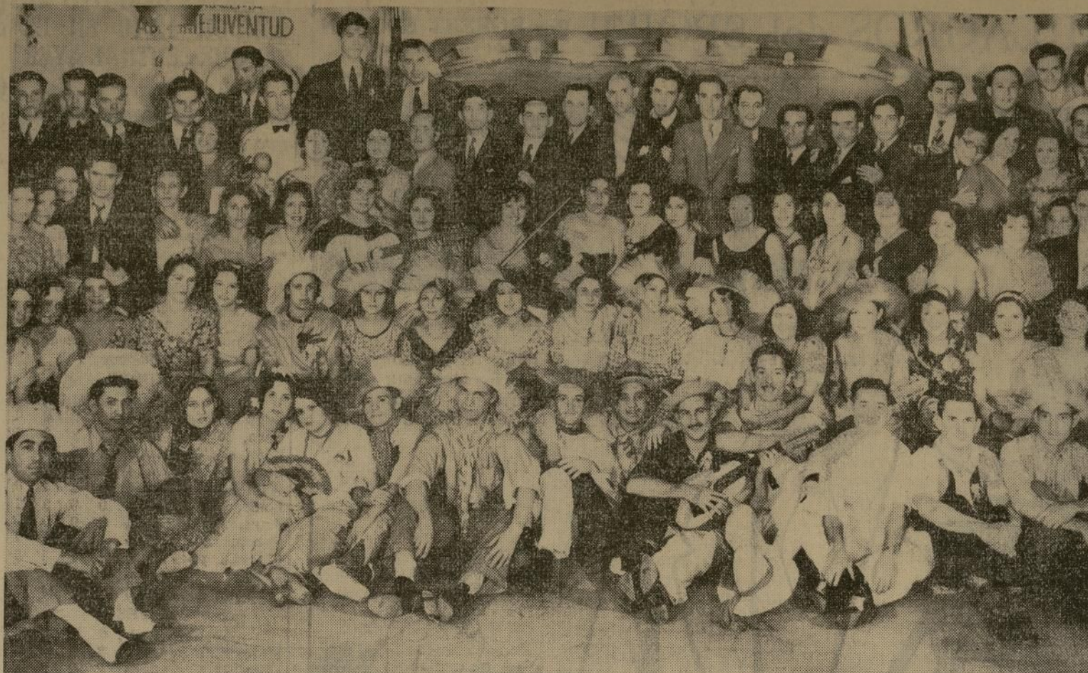
"Poly Hills Social Club" pareció en la noche del sábado último uno de los "soberanos" más concurridos de cualquier barrio de Puerto Rico con las bellas y atractivas jibaritas y los apuestos "guachinangos" que concurrieron al acontecimiento social que resultó el Gran Baile Jibaro organizado por esta sociedad.