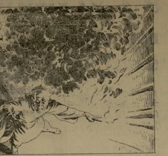
Weymouth sopó el ruidito nuevamente y se le respondió.

(Continuación de la sexta página) son tan imperitiosos y tan insensados como Manuel V. Domenech. Se habla de la figura que ha sido Manuel V. Domenech en el Partido Unión Republicana, y sobre eso yo quiero decir hoy algo al país. Para mí el señor Manuel V. Domenech, es un político que resulta ser de un valor falso, una monía. Manuel V. Domenech debe su ascendencia política al favor y al privilegio que en el pasado recibió de funcionarios extraños al país, nombrándose para un alto cargo en el reaccionario y detestable Consejo Ejecutivo durante el régimen del odiado Bill Foraker, en premio sólo a la actitud incondicional y pitufanqui del señor Domenech después de la invasión americana en Puerto Rico. El país no conoce un solo gesto, un solo hecho, una sola actividad del señor Manuel V. Domenech, que represente labor desinteresada y altruista por ningún partido político ni por el país.