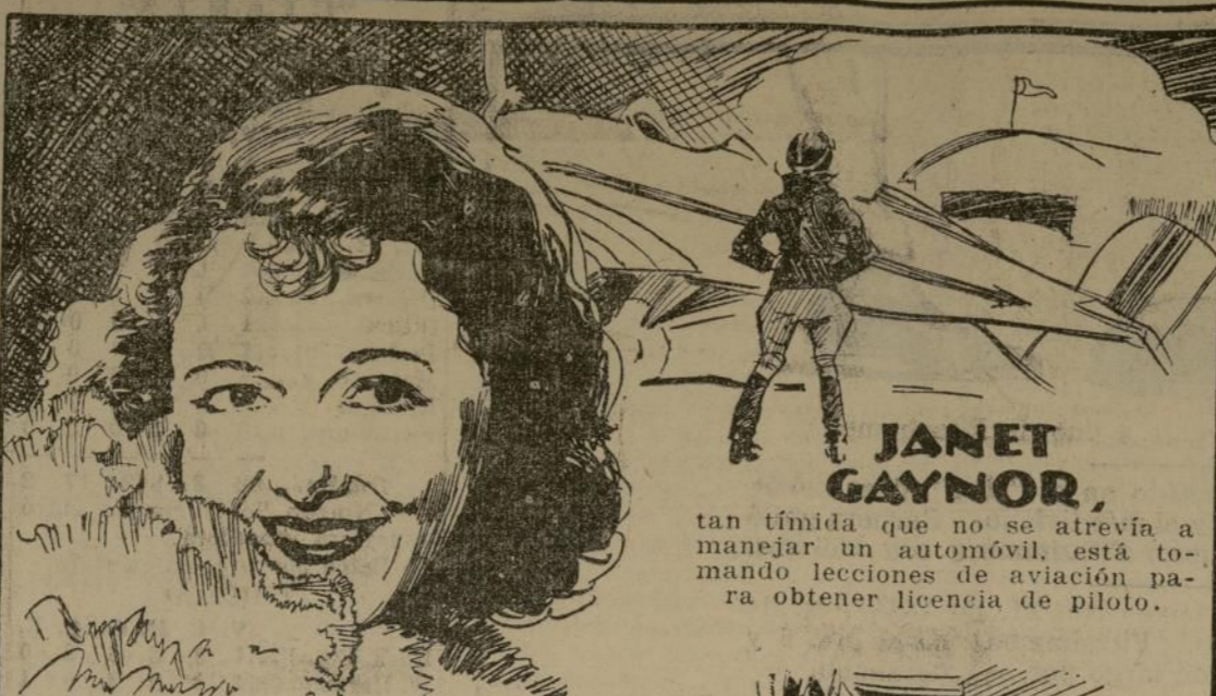
JANET GAYNOR, tan tímida que no se atrevía a manejar un automóvil, está tomando lecciones de aviación para obtener licencia de piloto.