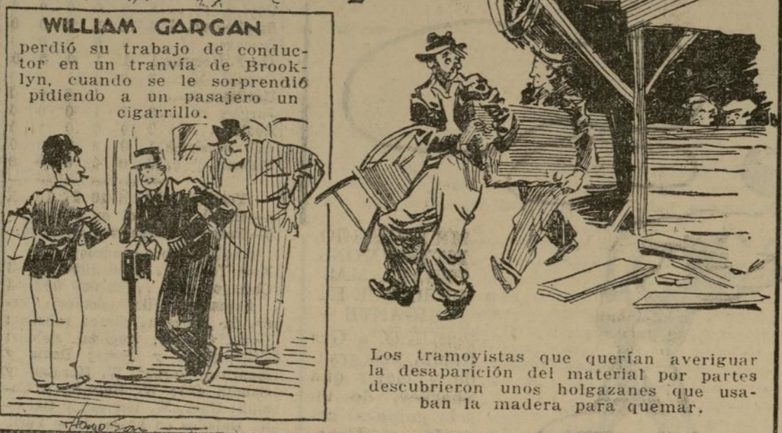
Los tramoyistas que querían averiguar la desaparición del material por partes descubrieron unos holgazanes que usaban la madera para quemar.