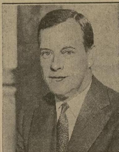
Joseph V. McKee

Se asegura la seguridad de Washington de no intervenir en la política local. — Whalen era mencionado como probable sustituto de McKee.