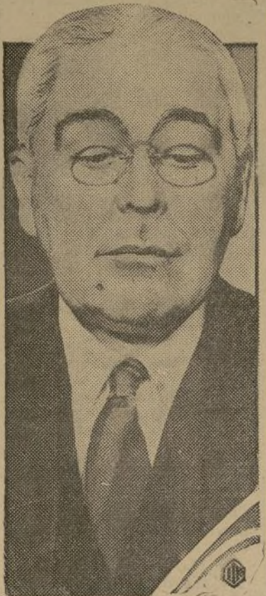
Juez Samuel Seabury