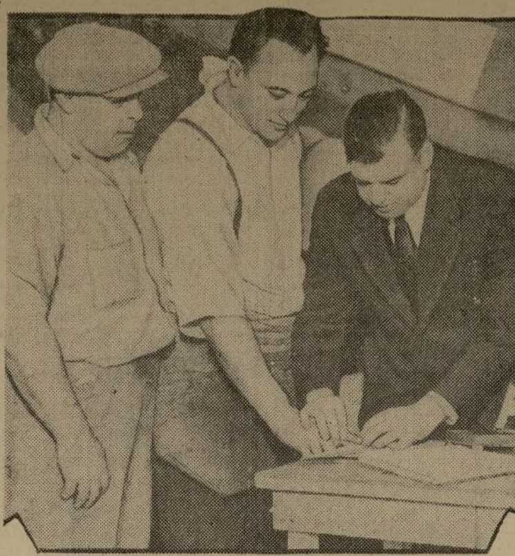
En cumplimiento de una ley del Estado dirigida contra la fabricación ilícita de cervezas, los empleados de una fábrica de Brooklyn se ven en la fotografía mientras un perito les toma las impresiones digitales.