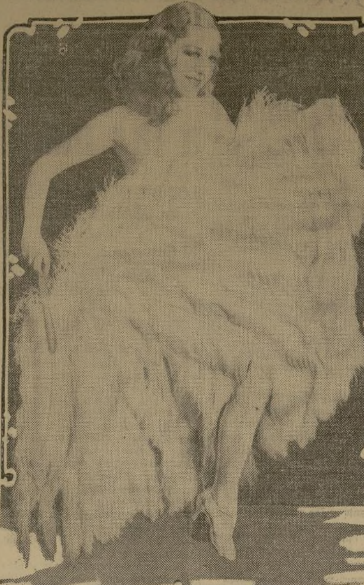
Sally Rand, cuya danza del abanico la hizo famosa, dispone de multa que le ha sido impuesta cuando su baile de Chicago fué sesenta días para apelar la sentencia de un año de cárcel y $200 condenado como "obsceno".