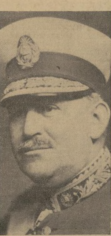
Presidente Agustín Justo

No se sabe si de intento o por casualidad, al abandonar O'Brien el desierto edificio el sábado por la noche, la banda de policía tocaba su acostumbrado concierto semanal y el alcalde fué despedido con los acordes de "Home, Sweet Home" y "Auld Lang Syne."