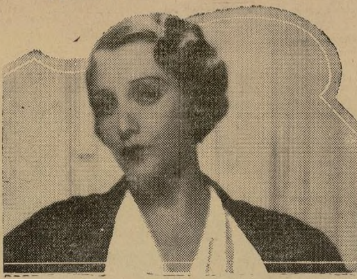
La bella Bebe Daniels, que en "Counselor at Law" en los teatros Regent y Hamilton desde ayer hasta el viernes, hace a cualquiera convertirse en el delincuente más despreciable de la tierra.