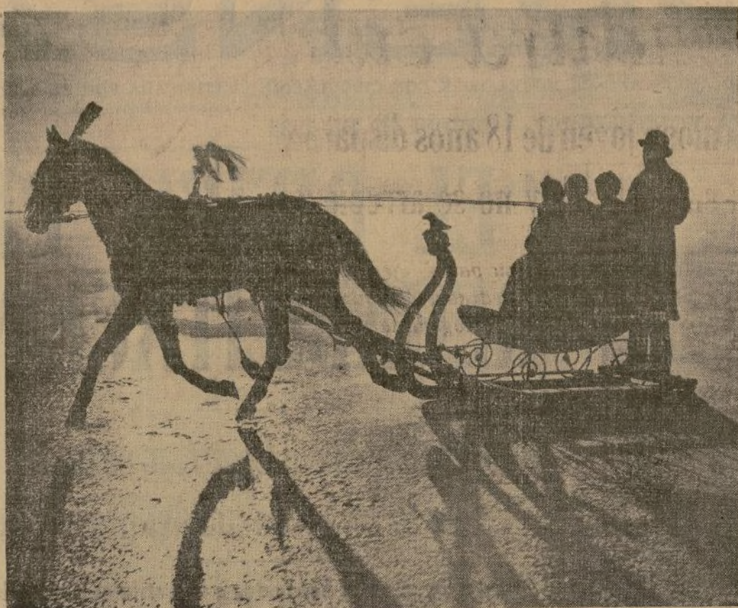
Un grupo de paseantes en trineo sobre el hielo formado por el río Gouwzee que está helado desde Amsterdam a Maarken.