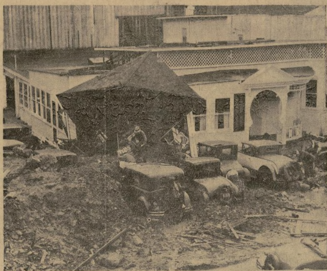
Vista tomada en Los Angeles en donde las aguas, después de una lluvia torrencial, anegaron extensas secciones, sembrando la muerte y la destrucción. A la izquierda se ven varios automóviles casi enterrados en una montaña de aluvión que fué arrastrado desde el valle cercano.