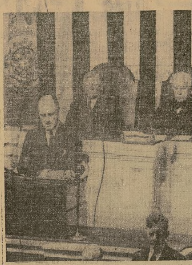
El presidente Roosevelt, hablando desde la tribuna de la Cámara de Representantes. Detrás se ven al vicepresidente McNary y al presidente de dicha Cámara, Rainey.