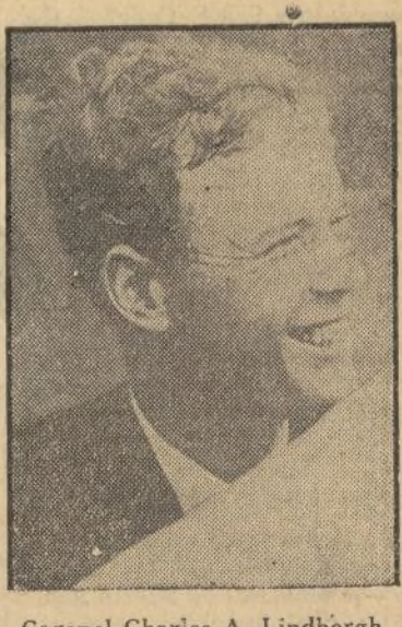
Colonel Charles A. Lindbergh

Blanshard imputa a Lemmerman el "despilfarrar de los fondos públicos" y el "pago de sumas exorbitantes" al arrendar oficinas (Sigue en la séptima página)