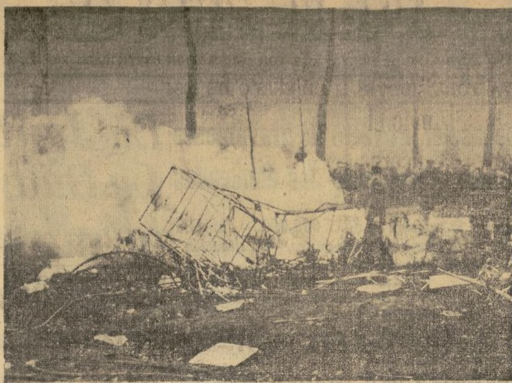
Restos del aeroplano inglés en que perecieron quemadas diez personas, al chocar el aparato con una torre radiodifusora en Ruysselede, entre Gante y Brujas, en Bélgica, incendiándose luego.