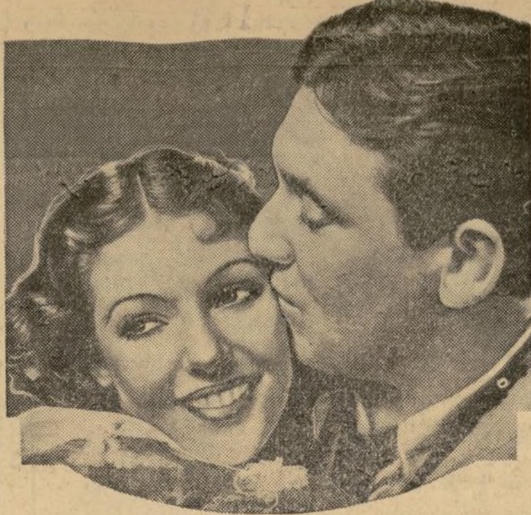
Loretta Young encantada de la vida con las cosas de Spencer Tracy en "Man's Castle," ahora en los teatros Regent y Hamilton.