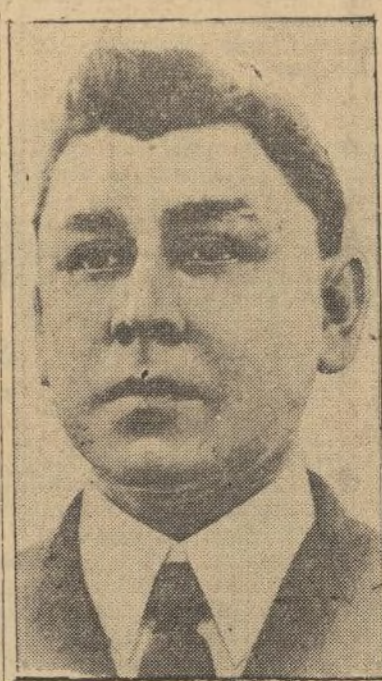
Sr. Adolfo de la Huerta

Este giro, que se debe a la feliz reorganización del gabinete del presidente Vargas, y el efecto de la visita del doctor Alfonso López en el ánimo decaído de las delegaciones, — que fue amigo de Grau y Batista — (Sigue en la octava página)