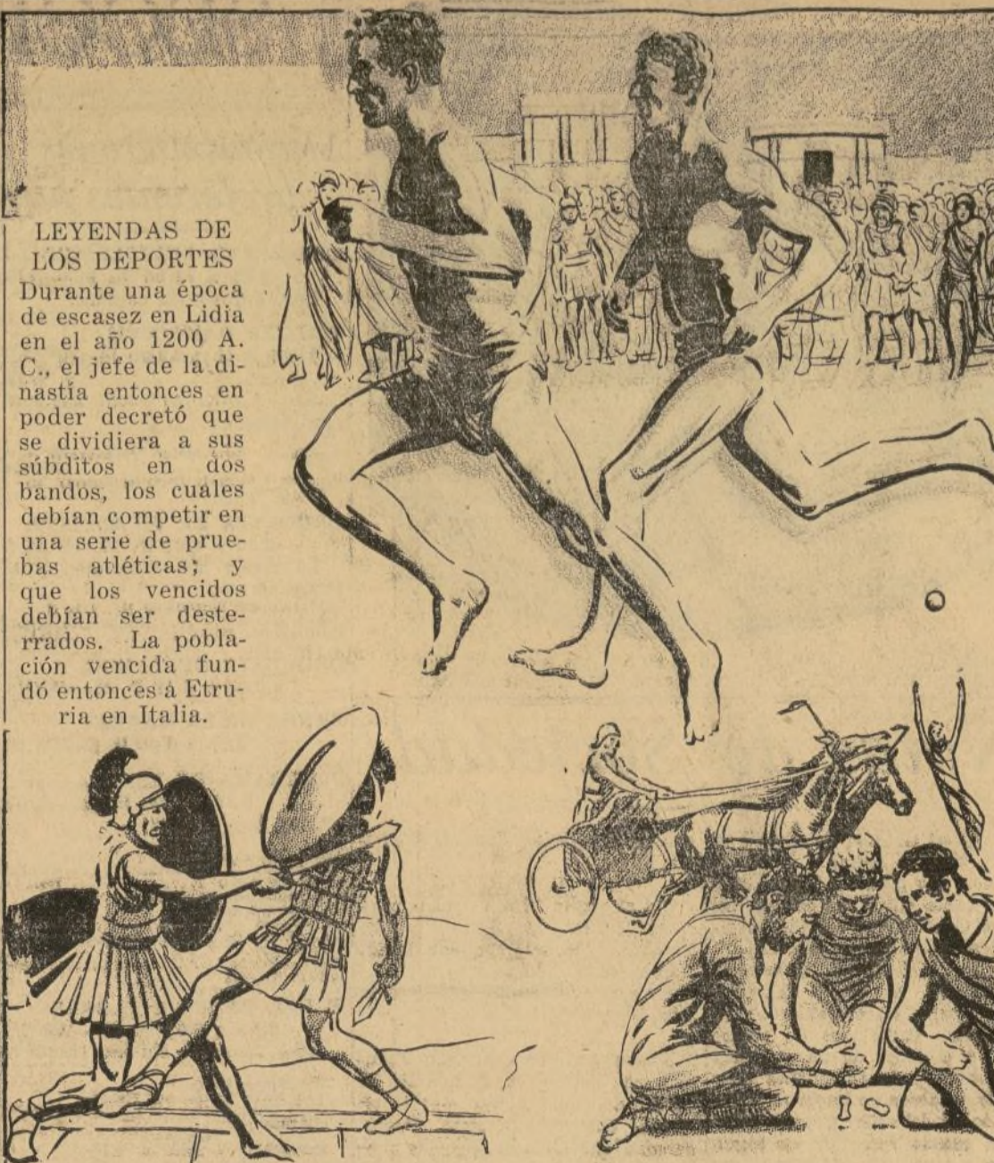
Horacio combatió a los descendientes de esos exiliados en el puente del Tiber. Se acredita a los lidios con el invento de los juegos de pelota, las canicas, los dados y las carreras de carros.