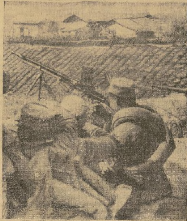
Tropas leales del general Chiang Kai Shek, disparando desde una choza, en sus operaciones contra los comunistas rebeldes en la frontera de las provincias de Kiangsi y Fukien, cerca de Nanchang.