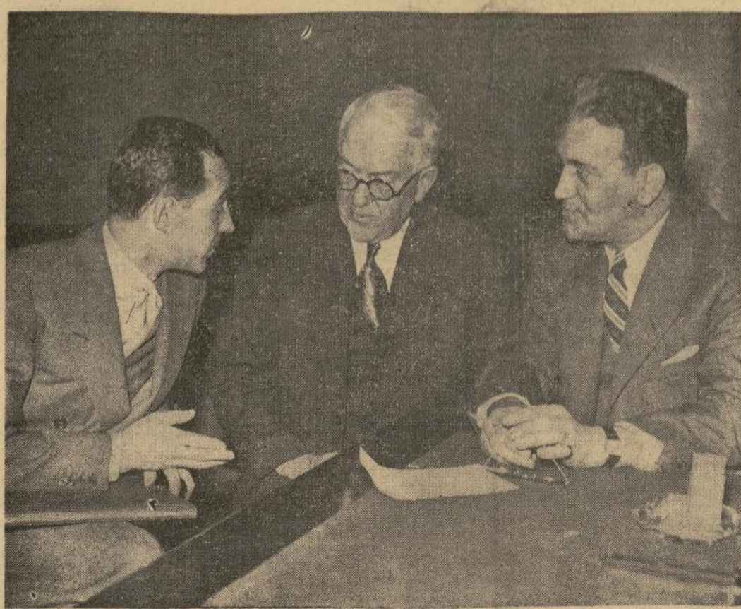
Edsel Ford con el senador Couzens, de Michigan, antiguo socio de su padre (en el centro) y Ferdinand Pecora, asesor del Comité del Senado durante la audiencia en que manifestó el primero que la Compañía Ford tenía depositados $32,000,000 en una cadena de bancos de Michigan y que él personalmente de dólares al grupo bancario.