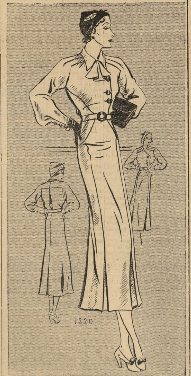
VESTIDO DE DIARIO

Paris nos asegura que podemos lucir elegantes con muy poco costo. Desde luego todas sabemos que debemos estar alerta para la nueva línea y corte de 1934 lo cual divide las modas para ciertos tipos, y ciertas ocasiones. Por ejemplo fíjense en nuestro patrón de hoy. Está hecho de un material de lana tan flexible y liviano, que la persona que lo usa no se da cuenta de que lleva un género grueso y de abrigo. Este modelo tiene varios puntos buenos. Entre otros se puede distinguir el cuello que es cambiante, y quizás por este especial distintivo es que ha sido muy aceptado en los grandes almacenes de modas. La falda es ajustada y recta y la blusa empataada a ella con sus mangas hasta la muñeca, hace que resulte un vestido muy práctico.