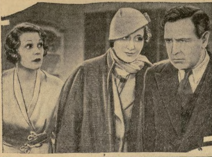
Así lo demuestran Alice Brady, Katharine Alexander y Conway Tearle en "Should Ladies Behave" que ahora se proyecta en el Loew's, calle 116.