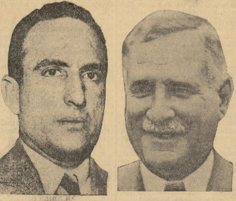
Presidente Carlos Hevia Coronel Carlos Mendieta