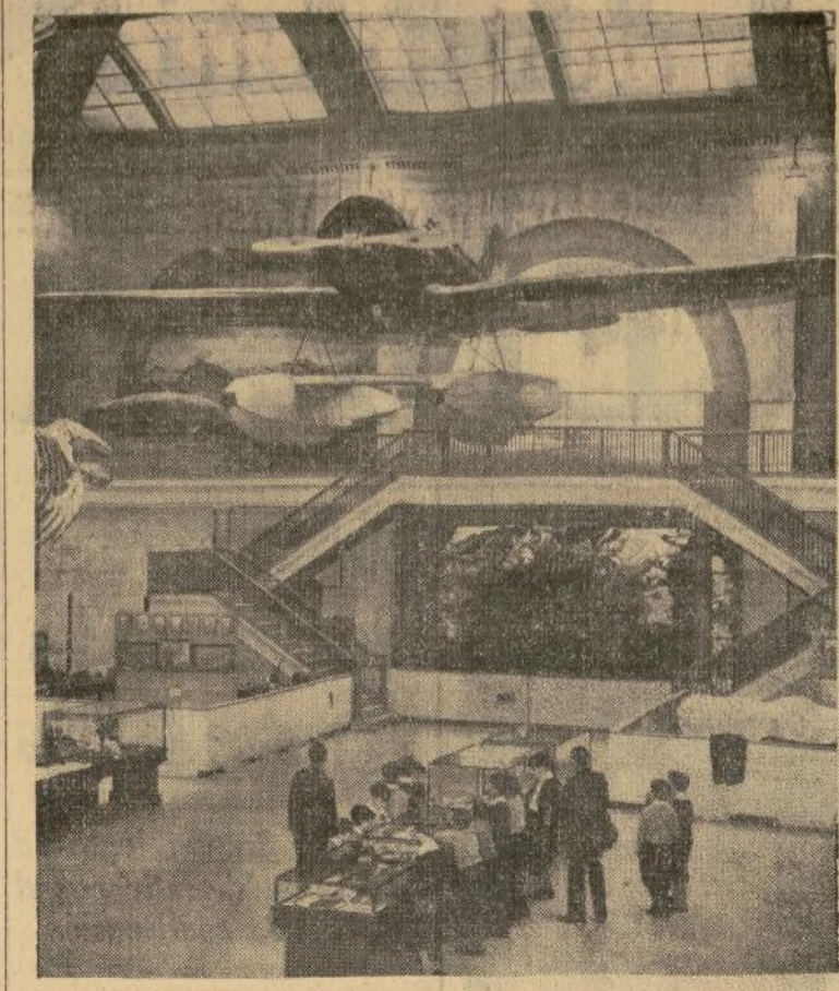
El hidro que utilizó el coronel en su última excursión aérea y que ha regalado al Museo de Historia Natural, expuesto en una de las salas de dicha asociación.