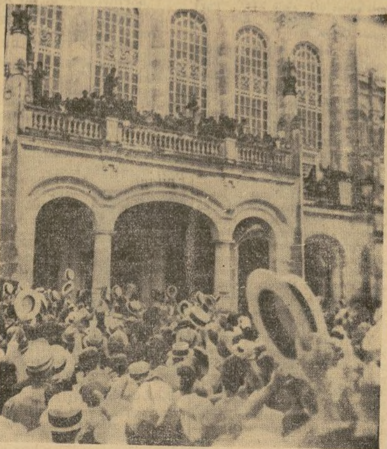
El nuevo presidente de Cuba, coronel Carlos Mendieta, recibiendo los vítores de la multitud al aparecer en el balcón del palacio, después de hacerse cargo del gobierno.