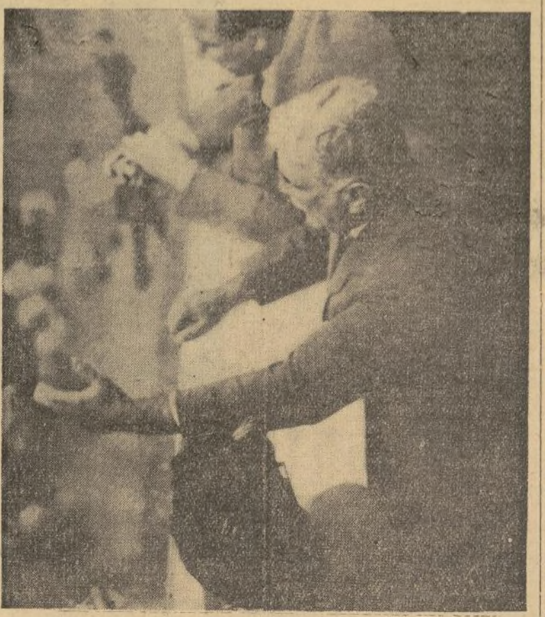
El coronel Carlos Mendieta pronunciando su primer discurso, desde el balcón del palacio presidencial en la Habana, poco después de prestar juramento de su cargo.