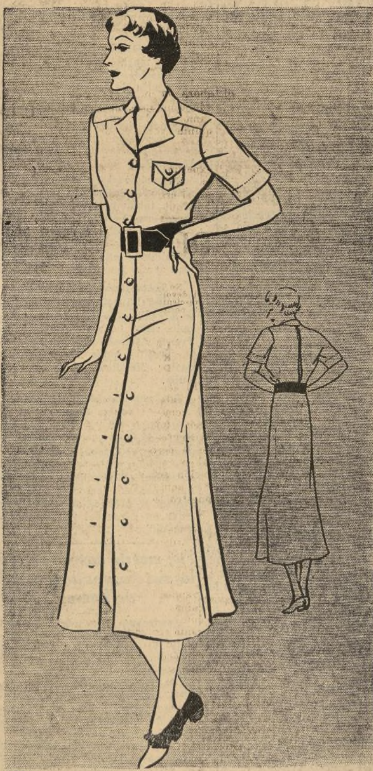
1226 VESTIDO DE PLAYA CON DOBLE OBJETO

1226.—Para muchas personas afortunadas que están, o proyectan estar dentro de breve tiempo en la cubierta de uno de los trasatlánticos cruzando el océano, o para las que no puedan soñar en esos viajes, pero que ya están planeando en preparar sus vestidos de verano para la playa, es muy práctico y cómodo este modelo. Es muy difícil en vestidos de esta índole poder distinguirlos un corte de elegancia y distinguido, por el hecho de que la vestimenta para deporte siempre tiene un aire especial de soltura y comodidad, pero mirando este modelo estoy segura que ha de tener gran aceptación por lo distinguido y correcto de sus líneas. Para correr en bicicleta y otros deportes, así como este vestido encima de la falda.