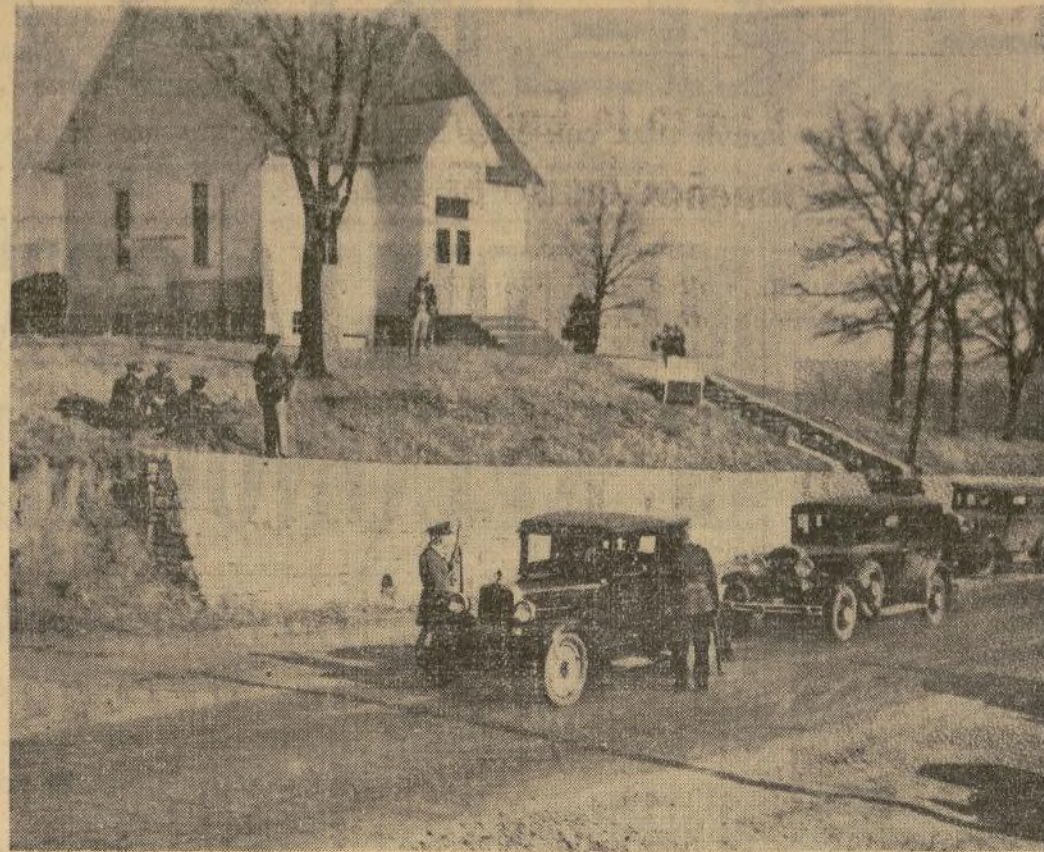
Automóviles detenidos en una carretera de Lansing, Kansas, en donde la milicia del Estado y la policía local tienen órdenes de registrar todos los automóviles con el fin de buscar a los criminales que se escaparon del penal de aquel Estado.